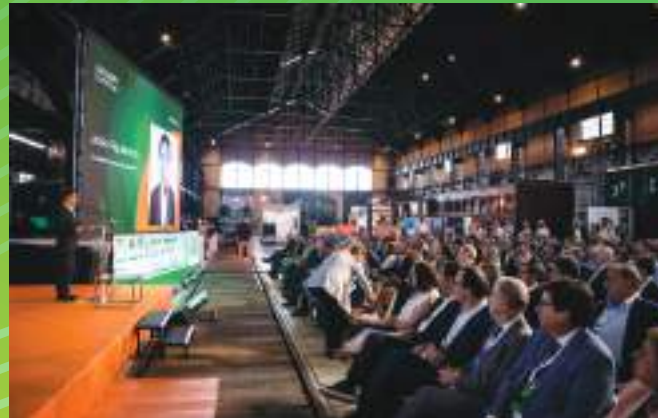
4ª Edição | Entroncamento, Maio 2023