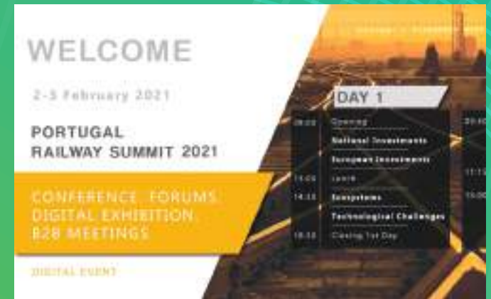
2ª Edição | Evento Online, Fevereiro 2021