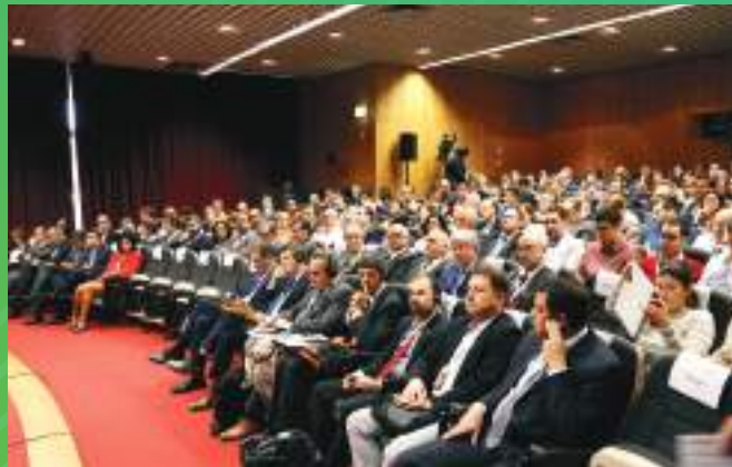
1ª Edição | IP-Infraestruturas de Portugal, Novembro 2019