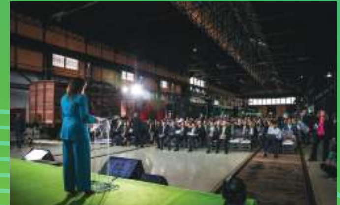
5ª Edição | Entroncamento, Maio 2024