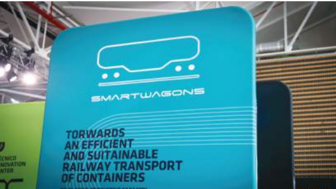
Stand 1.5x2.30m | Silver Sponsor