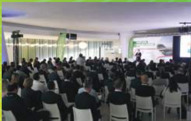
3ª Edição | Porto de Leixões, Maio 2022