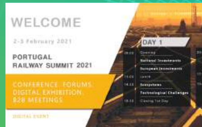
2ª Edição | Evento Online, Fevereiro 2021