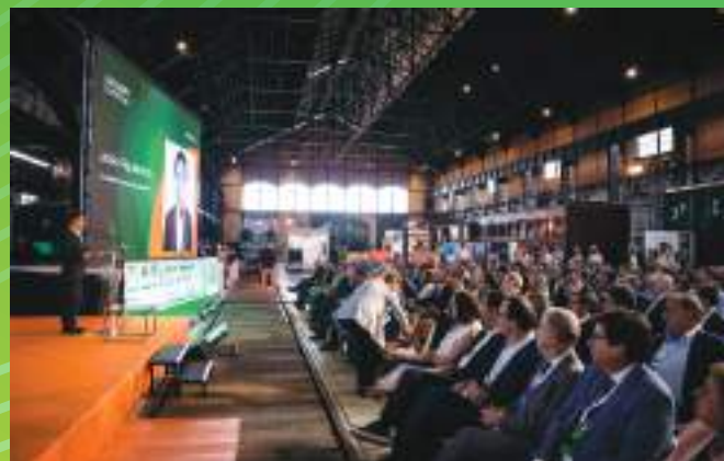
4ª Edição | Entroncamento, Maio 2023