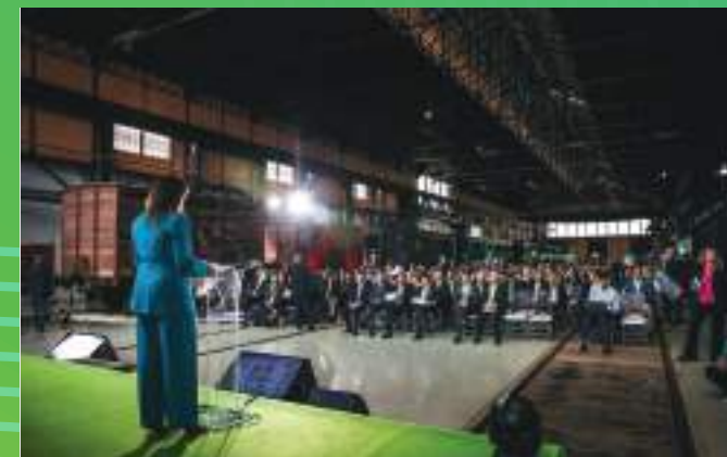
5ª Edição | Entroncamento, Maio 2024