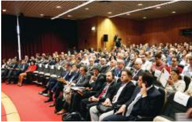
1ª Edição | IP-Infraestruturas de Portugal, novembro 2019