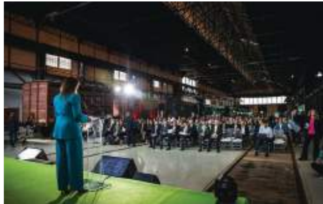
5ª Edição | Entroncamento, maio 2024