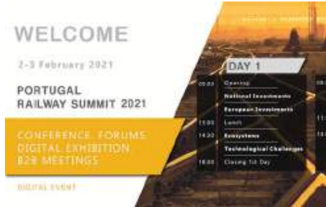
2ª Edição | Evento Online, fevereiro 2021