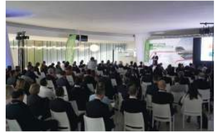
3ª Edição | Porto de Leixões, maio 2022