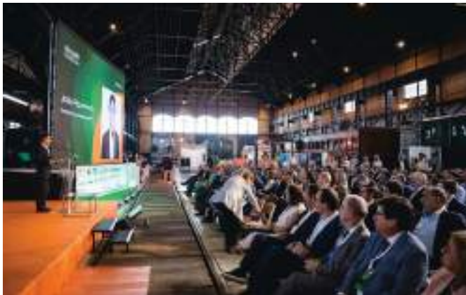
4ª Edição | Entroncamento, maio 2023