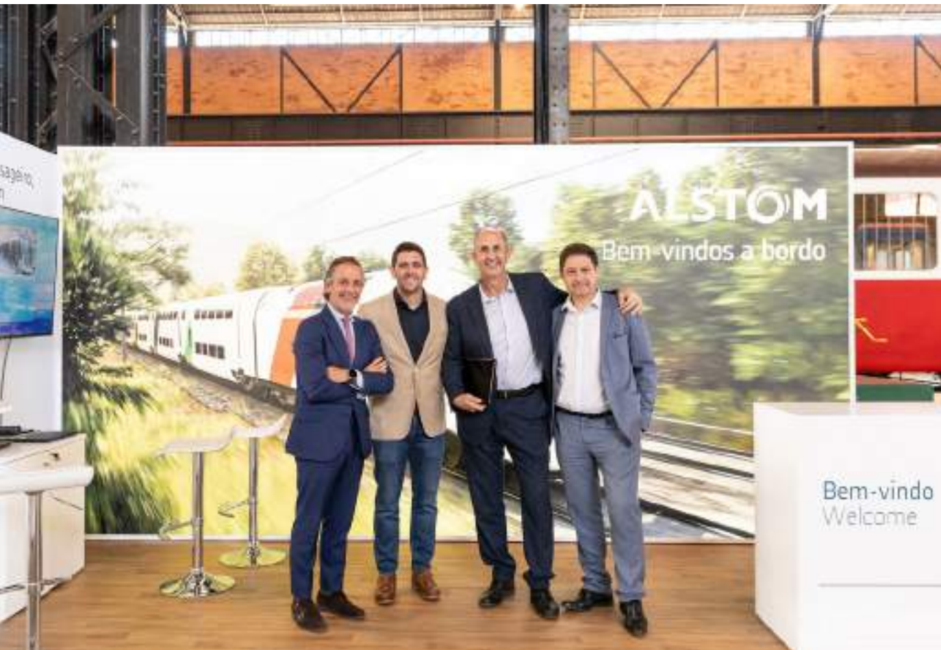
Stand 6x2m | Master Platinum Sponsor - exemplo