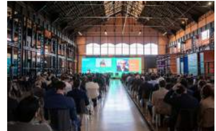
6ª Edição | Entroncamento, maio 2025